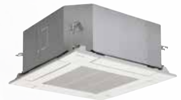
Bedrade of infraroodbediening mogelijk